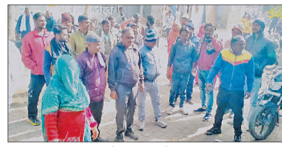
महेन्द्रगढ़। कार्यालय में नारेबाजी करते कर्मचारी।