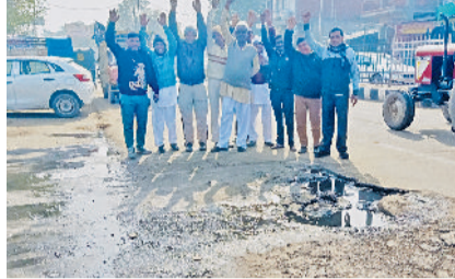
बवानीखेड़ा। गंदे पानी की निकासी की मांग को लेकर नारेबाजी करते हुए।