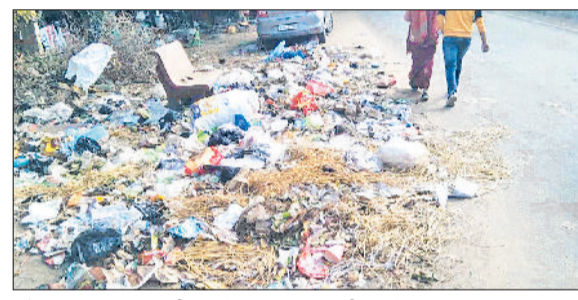
महेन्द्रगढ़। महिला आईटीआई के पास लगा गंदगी का ढेर।

नगर पालिका सफाई कर्मचारियों की हड़ताल के चलते शहर की सफाई व्यवस्था पूरी तरह चरमरा गई है। हड़ताल के चौथे दिन होने से सड़कों, बाजारों व रिहायशी इलाकों में कूड़े के ढेर लग गए हैं। प्रति दिन निकलने वाला करीब 15 से 20 टन कचरा उठान न होने से बीमारियों का खतरा बढ़ गया है। पुराने नारनौली रोड, भगवान परशुराम चौक, सिनेमा रोड व सज्जी मंडी क्षेत्र में हालात सबसे खराब हैं। कचरे के कारण आवारा पशुओं का जमावड़ा टन कचरा उठान लगा रहता है, यातायात भी हो रहा प्रभावित