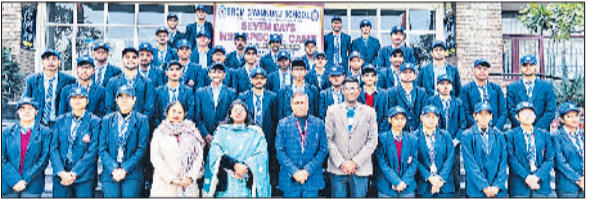
बहल। एनएसएस शिविर के दौरान उपस्थित केडेट्स।