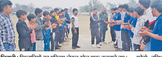
भिवानी। खिलाड़ियों का परिचय लेकर खेल शुरू कराते हुए।

ढाणा नरसान में सामाजिक संस्था नेताजी सुभाष चंद्र बोस युवा जागृत सेवा समिति एवं सदाचारी शिक्षा समिति के संयुक्त तत्वावधान में नशा छोड़ो-खेलो-सड़क सुरक्षा अभियान के तहत वनडे क्रिकेट मैच का आयोजन किया गया। इस आयोजन का उद्देश्य युवाओं को खेलों के माध्यम से नशा मुक्ति, स्वस्थ जीवनशैली और सड़क सुरक्षा के प्रति जागरूक करना रहा।