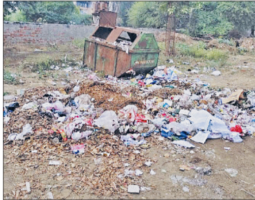
भिवानी। सचिवालय में रखे जर्नेटर के पास उगे खरपतवार व जर्नेटर के साथ उगे झाड़ियां व सचिवालय परिसर में पड़ा कचरा।