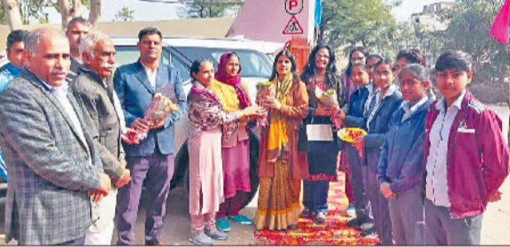
महेन्द्रगढ़। कार्यक्रम में मुख्यातिथि का स्वागत करते हुए।