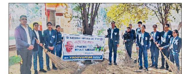
महेन्द्रगढ़। साफ-सफाई करते स्वयंसेवक।