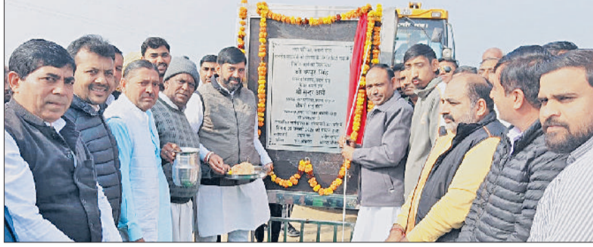
बवानीखेड़ा। सिटी पार्क का शिलान्यास करते हुए विधायक कपूर वाल्मीकि व नपा प्रधान सुंदर अत्री सहित अन्य।

बवानीखेड़ा में हांसी चुंगी एवं बिजली निगम कार्यालय के पास बनने वाले सिटी पार्क का शिलान्यास विधायक कपूर सिंह द्वारा किया गया। इस पार्क पर लगभग 3 करोड़ 20 लाख की लागत आएगी। इस कार्य को लेकर शहरवासियों में आस की उम्मीद जगी है। लोगों ने विधायक कपूर वाल्मीकि व नपा चेयरमैन सुंदर अत्री के कार्य की सराहना की। उल्लेखनीय है कि शहरवासी कांग्रेस सरकार के समय से पार्क की मांग उठा चुके हैं कांग्रेस सरकार में ये पास हुआ तो इसे कहीं और ले जाया गया, लेकिन बीजेपी सरकार की पिछली दो योजनाओं में भी ये मांग पूरी तो हुई लेकिन इसमें दिक्कतें आने के कारण ये सिर नहीं चढ़ पाया। विधायक ने इस मांग को विधानसभा सत्र में भी जोर-शोर से उठाया का कार्य किया था तो नए चेयरमैन सुंदर अत्री ने भी चुनावों में शहरवासियों से पार्क बनवाने का वायदा किया था और अब जल्द ही बवानी खेड़ा में