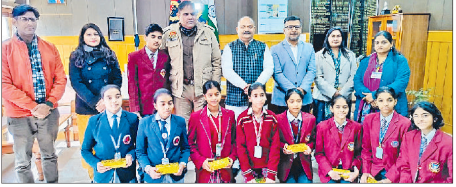
भिवानी। स्कूल में आयोजित कार्यक्रम में बच्चों के साथ पुलिस अधीक्षक व अन्य।