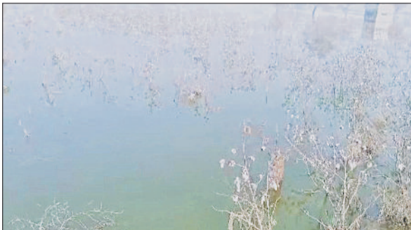
भिवानी। गांव लोहारी जाटू के खेतों में जमा बारिश का पानी।

भारी बारिश को हुए करीब 127 दिन का समय बीत गया, लेकिन अभी भी पानी की बर्बादी का दंश लोग झेल रहे हैं। हालात ये हैं कि आसमान से बरसा पानी आज भी खेतों में जमा है। इस माह में कपास की फसल खतम हो चुकी होती है, लेकिन जलभराव को वजह से आज भी खेतों में रूई युक्त कपास की फसल है, पानी की वजह से कपास की चुनाई नहीं हो पाई है। इस दरम्यान सरकार से जुड़े राजनेताओं ने पानी की निकासी, बर्बाद फसलों का मुआवजा दिलाए जाने के लाख दावे किए, लेकिन इतना समय बीतने के बाद आज तक पीड़ितों को एक फुटी कोड़ी भी हाथ नहीं लगी। यहां तक